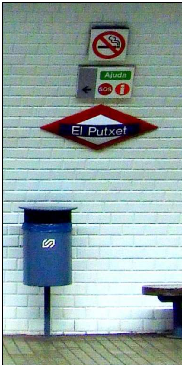
Rètol a l'estació El Putxet dels FGC