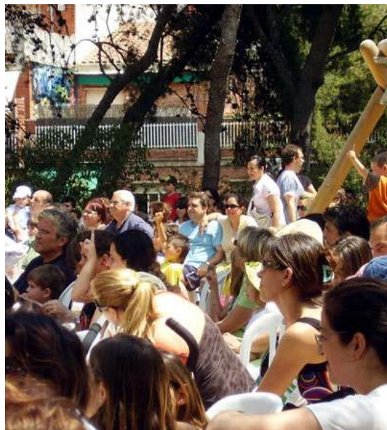
Públic a la festa infantil

Com que "no hay mal que por bien no venga", com a consolació adjuntem un gràfic de l'evolució setmanal dels pantans de les conques interiors de Catalunya .