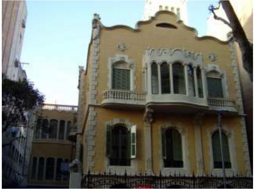
La torre Sans actual