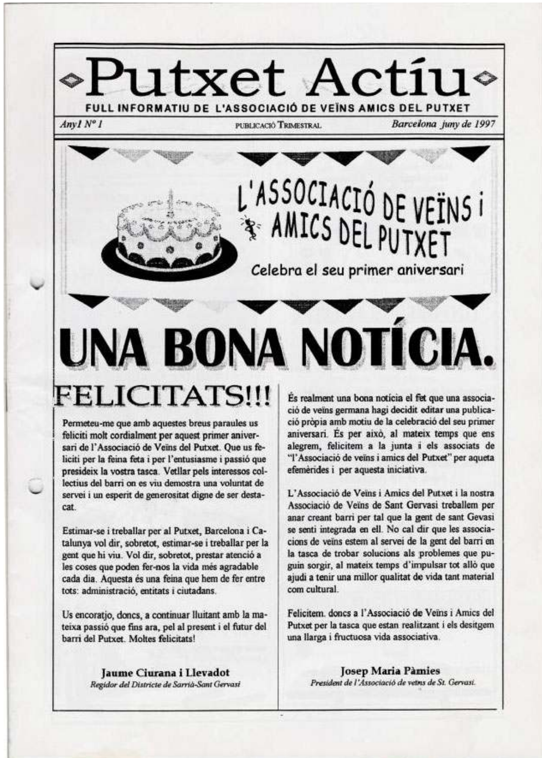
Facsimil de la portada del primer Putxet Actiu, aparegut fa 11 anys