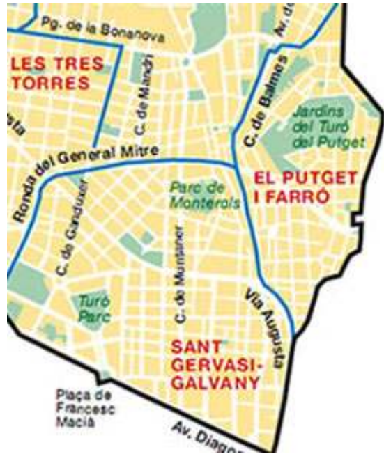
Mapa de districtes i barris (fragment)

també per tres turons de la carena que va paral·lela a Collserola, els d'en Modolell, de Monterols i del Puget (181 m, conegut a Barcelona per la forma apitxada, o falsament derivada, de Putxet)".