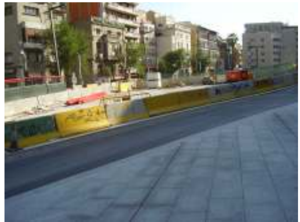
Plaça Lesseps al juliol: mirant cap al carrer Septimània des del peu de les escales de l'Església

Les obres de Lesseps també arriben al final, així com la primera fase de la seva continuació en sentit Llobregat: la remodelació del tram de la Ronda del Mig des del carrer Homer fins al carrer Puigreig.