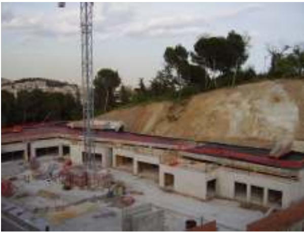
Les obres de l'escola i el casal del c.Marmellà , al juny

Les obres de l'escola bressol i del casal s'estan acabant (un any més tard del que s'havia previst), i les del poliesportiu començaran aquest estiu i està previst que durin 12 mesos.