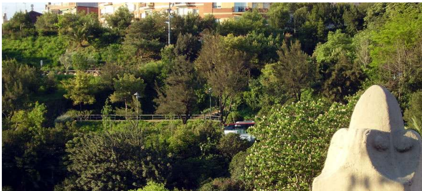
Els jardins de la muntanyeta vistos des del pont de Vallcarca

Amb tot aquest bagatge i el coratge infatigable de la Mònica i d'altres membres de l'Associació, al llarg de l'any 1996 s'adreçaren a l'Ajuntament reiterades peticions de netejar i enjardinar aquest solar i de construir-hi a sota un aparcament, atesa la dificultat de trobar-ne dins del barri 7 .