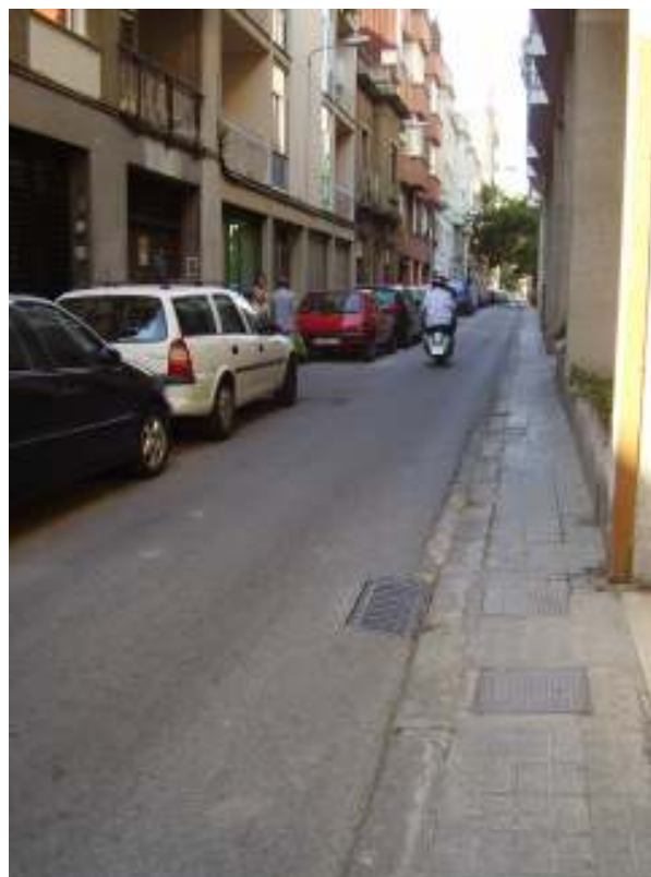
Imatges: el carrer Pàdua, un dels carrers del barri amb voreres de quatre pams.