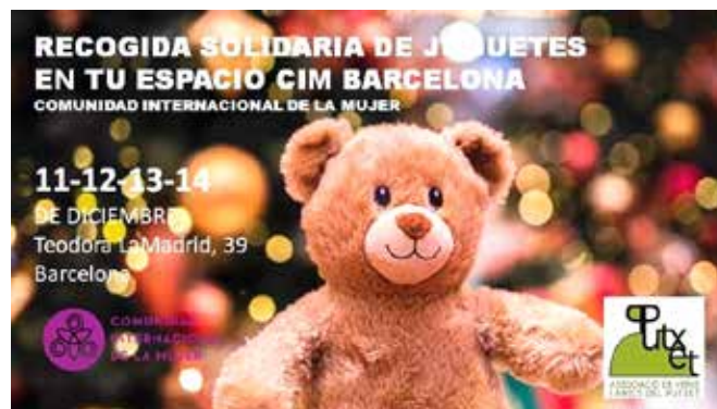
Recollida en la Comunitat Internacional de la Dona