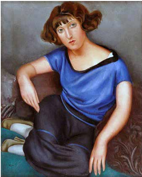
Josep de Togores, Retrat de Madame Claire (1922)