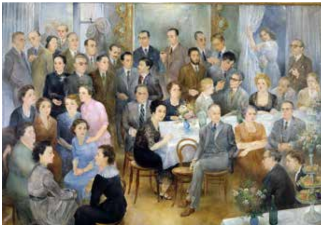
Olga Sacharoff. La Colla del Putxet (1945, MNAC)