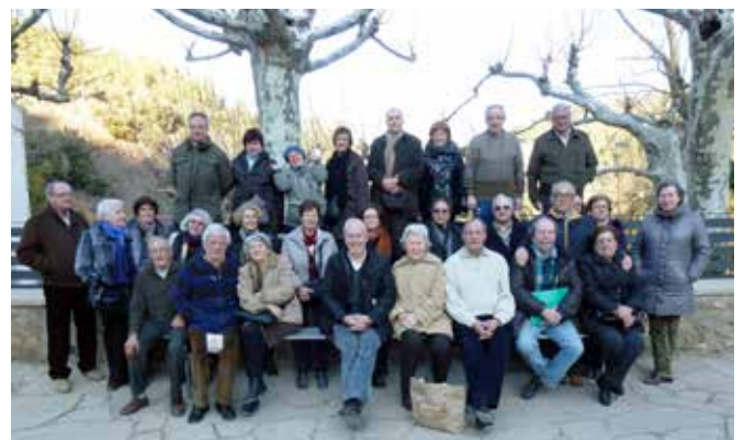
Participants de la calçotada a prop de l'Espluga de Francolí